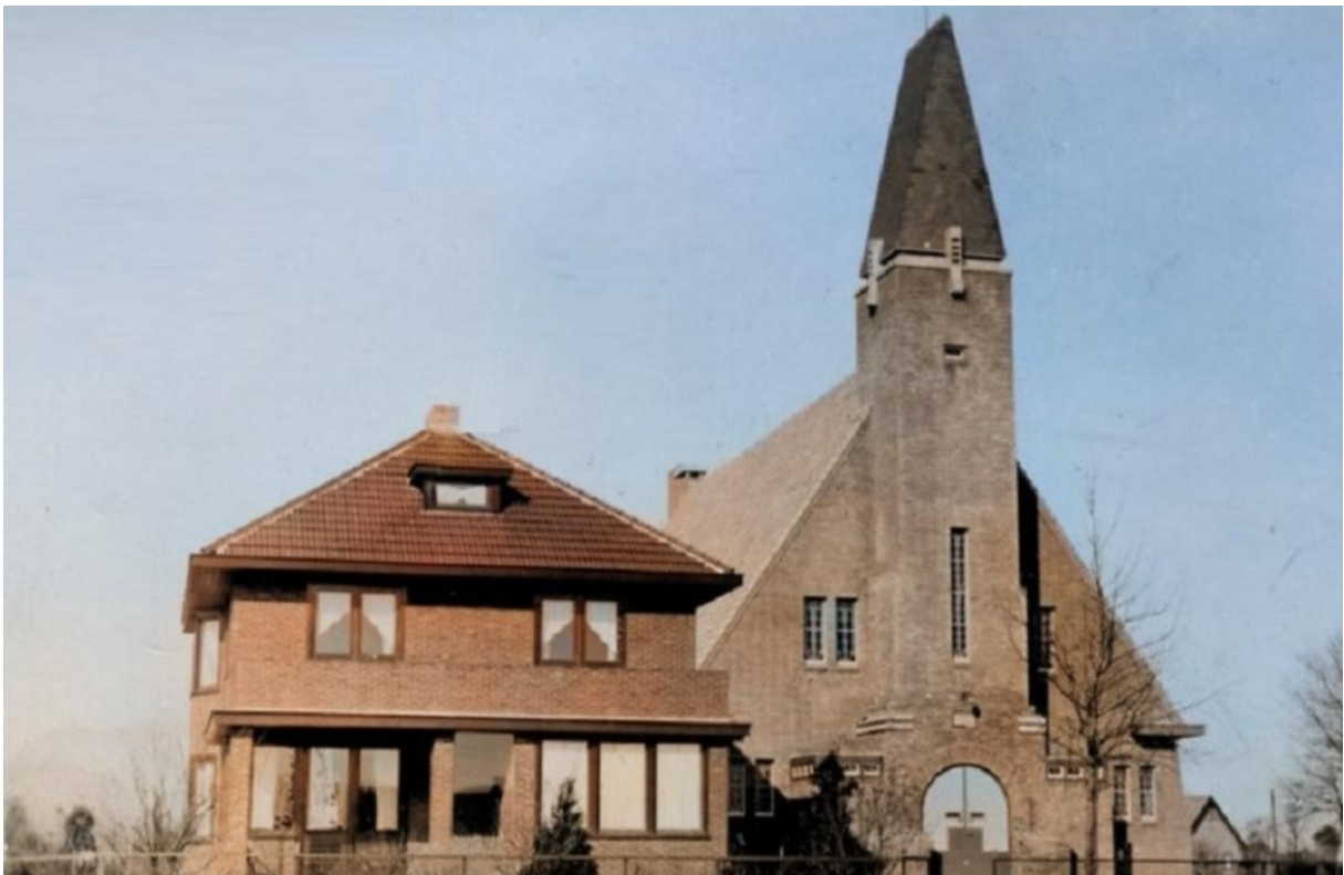
Gereformeerde kerk Mariënberg